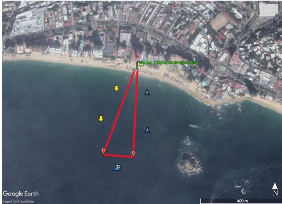
MAPA RECORRIDO SPRINT ROQUETA